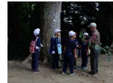
神社の木の周りを測る