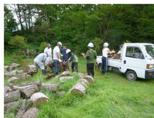
機械による薪割作業

NICEはNever-ending International work Camps Exchangeの略