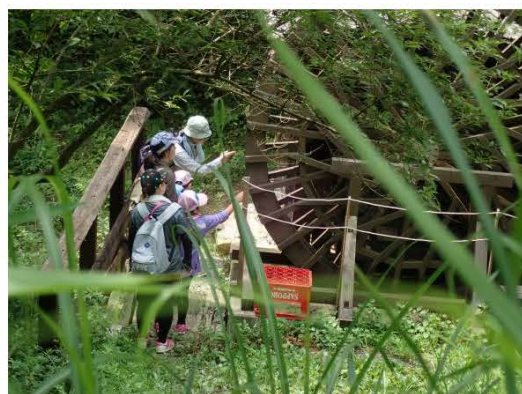
環境企画課「自然探訪会」