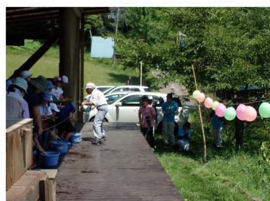
林務課「ファミリー緑の教室」水鉄砲で遊ぶ