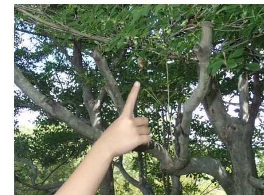
セミの抜け殻見つけた