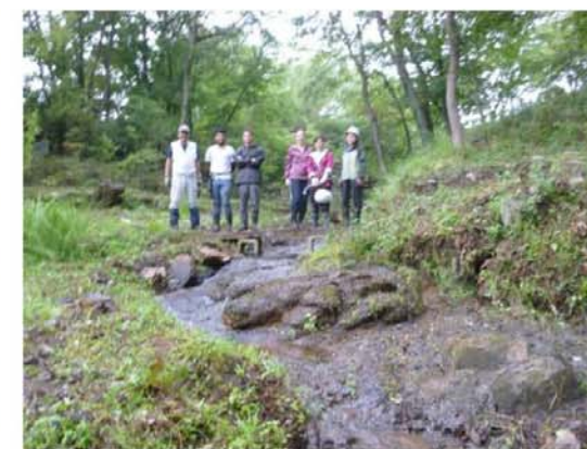
棚田跡地の沢の整備