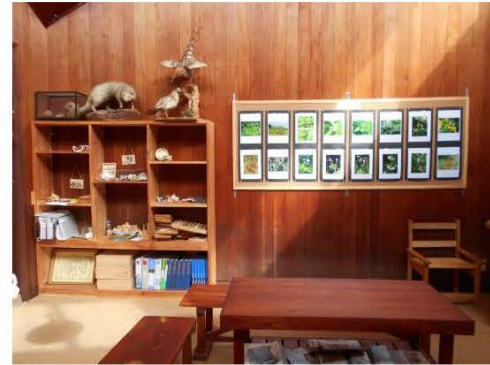
陳列棚・掲示パネル