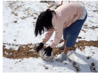
3, 令和5年2月11日(土) 参加者26名

福島ネイチャーゲーム協会とのコラボが実現しました。自然の中で五感を使ったゲームを楽しんだり、カムフラージュを楽しみました。暖かい日差しの中、芝生広場に歓声が響いていました。