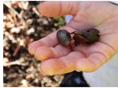
4, 令和5年2月25日(土) 参加者42名

福島ネイチャーゲーム協会とのコラボ2回目。自然の中の色探しやいろいろな自然の形を見つけました。子どもたちは、芝生広場を思いっきり走り回っていました。最後みんなで記念写真。たくさんの笑顔の花が咲きました。