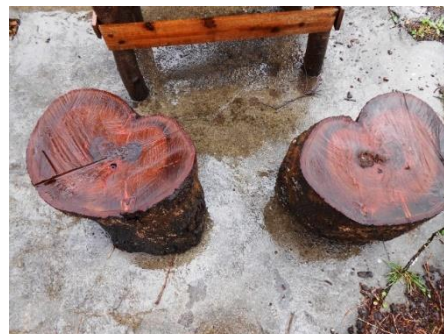
切った枝のツール