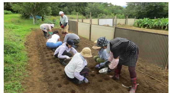
9月2日 ラッキョウの植え付け

9月2日にワークキャンプの若者たち4名(今回は女性のみ)が来場して、いろいろな作業を農業班の皆と行いました。まず、鎌で草刈り作業のあと畑でラッキョウの種球の植え付け作業を行いました。やや深めの植穴に種球を植え、土をかぶせていきます。またブルーベリー、ハウストマト、さつま芋などのお土産付き収穫体験も行い、昼前に無事終了しました。