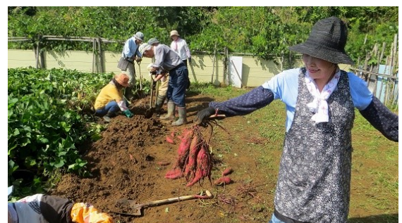
9月30日 さつま芋を掘り上げた

さつま芋の自家苗植え付けは今年の5月13、19、20、27日と7月10日の計5回行いましたが、そのうち5月13、19日植え付け分のさつま芋の収穫を行いました。昨年の12月に落ち葉堆肥を投入した効果か、芋の出来はまずまず良好でした。約15m長さの畝が1列半終わり、あと5列半を晩秋にかけて収穫する予定。